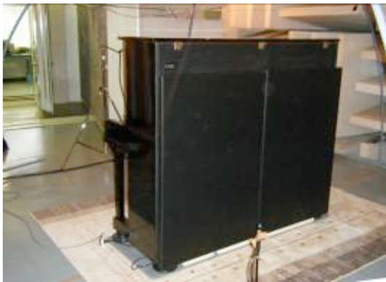
東京都立産業技術研究センターの半無響室にて測定風景